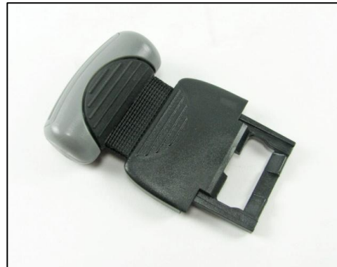
Le remplacement est en nylon au lieu du caoutchouc.

Solution: Les consommateurs doivent immédiatement cesser d'utiliser leurs vestes avec des pochettes de lest qui ont des poignées en caoutchouc SureLock II. Apportez les pochettes à votre détaillant Aqua Lung autorisé. Il sera en mesure de remplacer vos poignées pendant que vous attendez. Changer les poignées est un processus rapide. Le tout est effectué sous garantie et sans aucun frais.